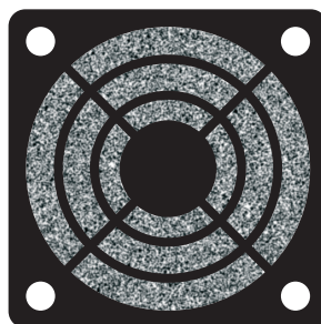
Пластиковые решётки с фильтром (FGF)