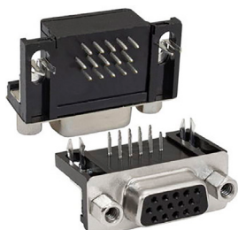
DHR-F под пайку в плату угловая