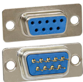
DPS-F под пайку в плату прямая