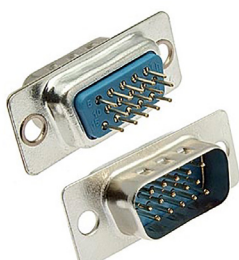
DHB-M под пайку в плату прямая