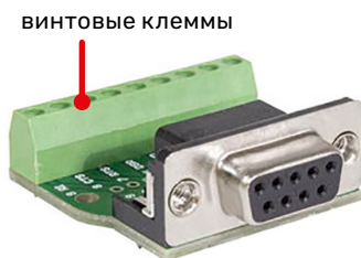
Розетка 903-F под винт на кабель