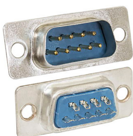
DB-M под пайку на кабель