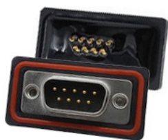
Вилка DB-9M IP67 влагозащищённые исполнение разъёма