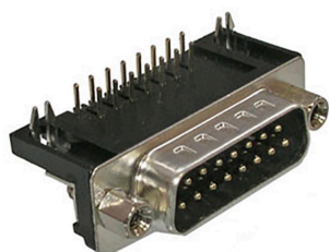
DRB-M под пайку в плату угловая