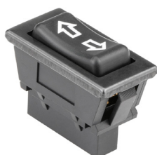
ASW-01 DPDT (ON)-OFF-(ON)