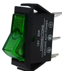
ASW-09-102G SPDT ON-ON