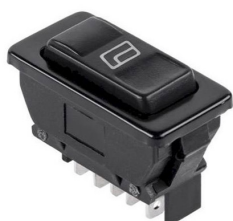
ASW-02D DPDT (ON)-OFF-(ON)