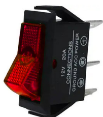
ASW-09D SPST ON-OFF