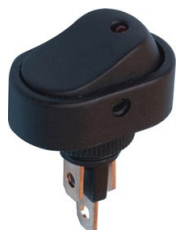
ASW-20D-3 SPST ON-OFF